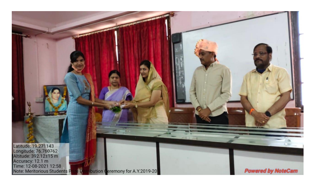
Meritorious Students Prize Distribution