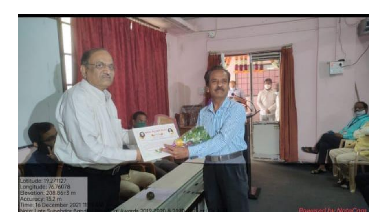
Late Shri Subehdar Bandhu Memorial Award