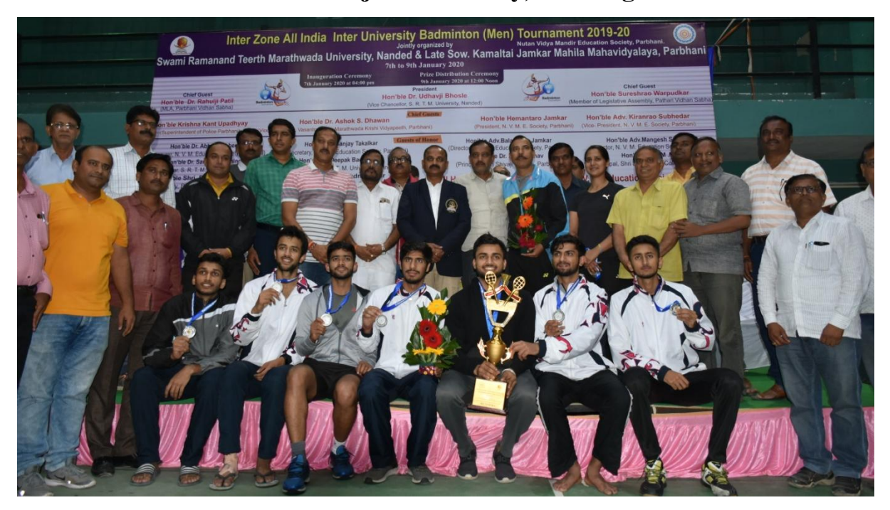
3<sup>rd</sup> Position - University of Delhi