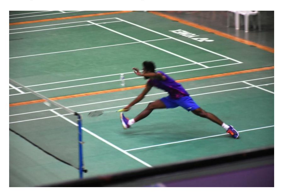
Knock out Matches

From 7<sup>th</sup> to 8<sup>th</sup> January 2020 at 7:00 am the League matches were started and for All India Inter Zone. 16 Universities from West, East, North and South Zone each 04 teams each those are qualified in the particular zones from all over India have taken part and competed for the winner trophies.