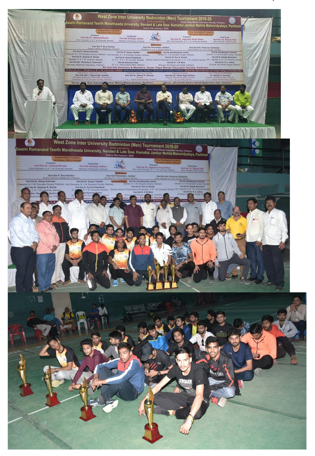
\mathbf{1}^{\mathrm{st}} Position - Savitribai Phule University, Pune